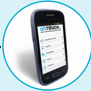
UnTouch Phone + App

Der Betrieb erfolgt auf einem gesicherten, für Sie kostenfreien Webserver.